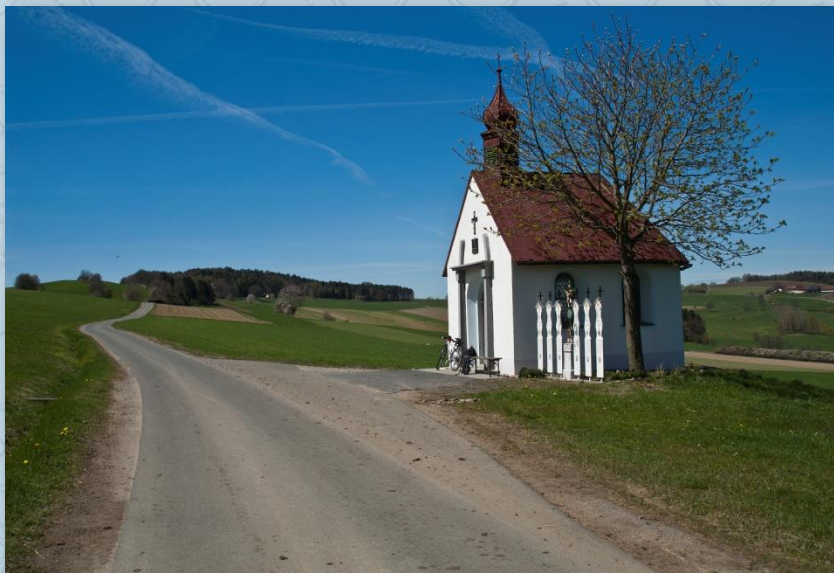
Kaple u obce Vorderbuchberg

Právě v místě, kde se cesta, vedoucí kolem kapličky, spojí za horizontem s asfaltkou, začíná totiž jakási zážitková trasa nazvaná "KLANGWEG" a pokračuje směrem doprava. Více se o ní dozvíte v "Turistických zajímavostech". Vrátime se zpět ke kostelu a pokračujeme po trase C3 směrem na Hinterbuchberg. V další obci Warzenried se na křižovatce dáme doprava a po cyklotrase C3(EV 13) jedeme až k hranici.