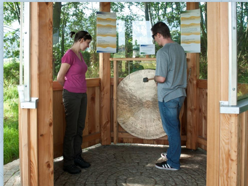
Jeden z objektů na trase „Klangweg“

Na křižovatce odbočíme doprava a cestou na jejímž kraji jsou hraniční patníky dojedeme k hraničnímu přechodu Všeruby. Hned za bývalou celnicí odbočíme doprava na panelovou cestu a jedeme zase podél hranice, tentokrát ale už po české straně. Dojedeme až na cyklotrasu 2050, odbočíme doleva na Fleky a přes Chudenín pokračujeme do Nýrska.